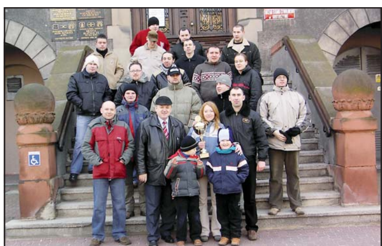
Pamiątkowe zdjęcie uczestników

W sobotę w godz. 11.00 – 13.00 w Krotoszynie odbył się IV Zimowy Międzyregionalny Zlot Miłośników Samochodów Marki Opel.