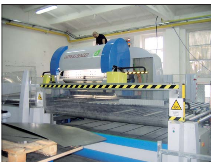
...i jedna z najnowocześniejszych maszyn w jego firmie

Opłata za dziecko przebywające w przedszkolu 8 godzin (i więcej) i korzystające z pełnego wyżywienia wzrosła od 1 marca br. o 5 zł. Na wzrost złożyło się podwyższenie opłaty stałej za przygotowanie posiłków: śniadania 28 zł (wcześniej 26 zł), obiadu 55 zł (wcześniej 53 zł), podwieczorku 27 zł (wcześniej 26 zł). Jeżeli maluch będzie chodził do przedszkola 20 dni w miesiącu, za przedszkole zapłacimy 182 zł. (mm)