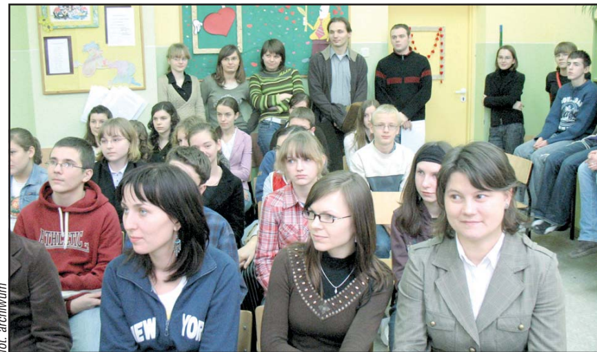
Już za chwilę ogłoszenie wyników...