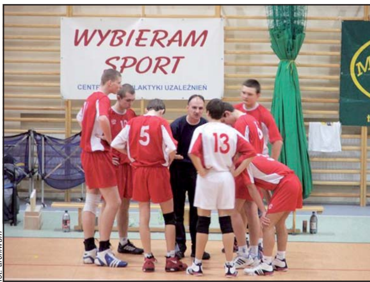
Krotoszyńscy medaliści w czasie narady z trenerem