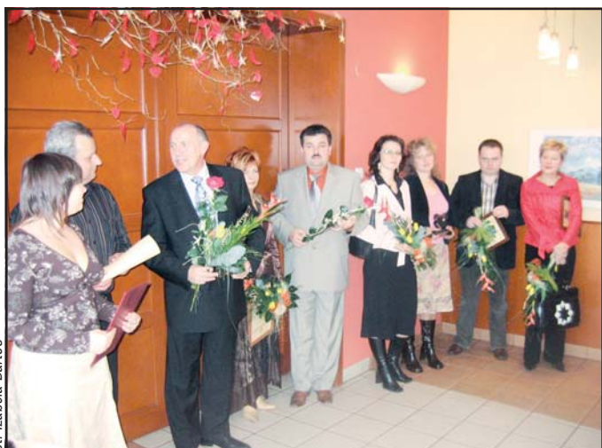
Przedstawiciele firm uczestniczących w konkursie

22 lutego w restauracji Impresja w Krotoszynie rozstrzygnięty został konkurs Prasy Lokalnej na najpopularniejsze przedsiębiorstwo i najpopularniejszy sklep w roku 2006.