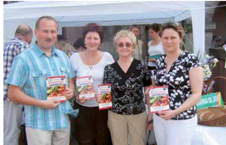
Autorki książki i wykonawcy testowanych dań

W niedzielę Dni Krotoszyna 2007 o godz. 15.00 odbyła się na Rynku promocja książki Krotoszyńskie smakołyki .