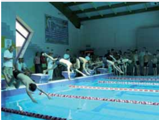
fot. archiwum (x2)