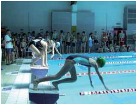
Skoki do wody – efektowna część zawodów

12 czerwca w pływalni Wodnik odbył się XVII Memoriał Pływacki Jana Szlachty. Organizatorem zawodów był Ośrodek Sportu i Rekreacji. Wzięli w nich udział młodzi pływacy z krotoszyńskich szkół podstawowych i gimnazjów.