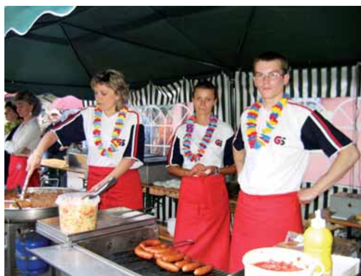
Kielbaski serwowano także w hawajskich rytmach

I na Hawajach czasem pada, o czym mogli się przekonać uczestnicy Festynu Hawajskiego, który odbył się w sobotę 2 czerwca na terenie Zespołu Szkół nr 1 z Oddziałami Integracyjnymi na Błoniu.