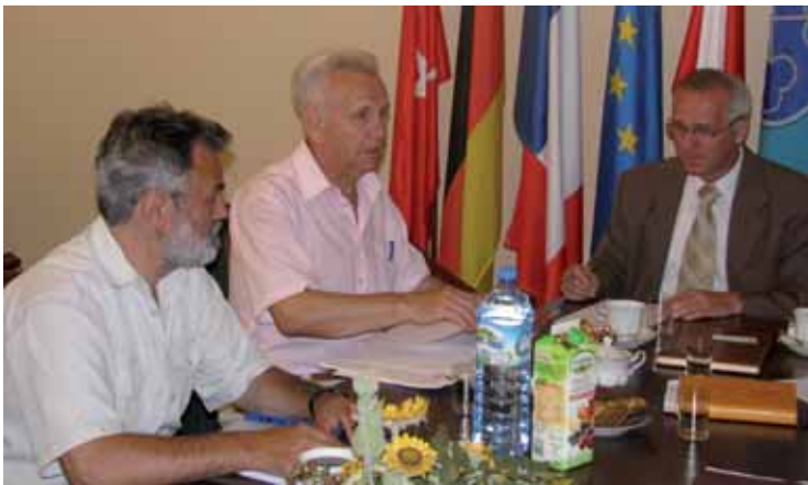
Audyt konkursowy przeprowadzono w ostatnią środę czerwca