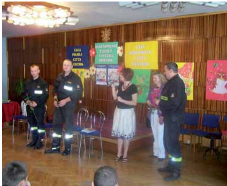
Strażacy zaprosili dzieci do obejrzenia wozów bojowych w komendzie straży

■ Już po raz siódmy Krotoszyńska Biblioteka Publiczna im. Arkadego Fiedlera aktywnie włączyła się w organizowanie kampanii społecznej Cała Polska Czyta Dzieciom zainaugurowanej przez Fundację „ABCXXI”.