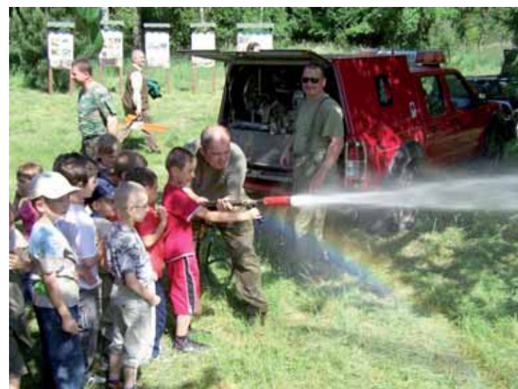
Pokaz gaszenia pożaru w lesie wzbudził duże zainteresowanie uczestników