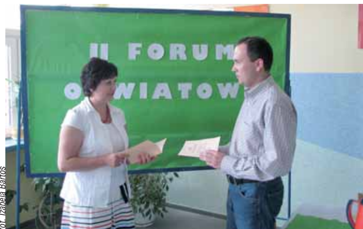
Forum było okazją do wymiany spostrzeżeń i wyciągnięcia wniosków

■ 5 czerwca w Gimnazjum nr 4 odbyło się II Lokalne Forum Oświatowe.