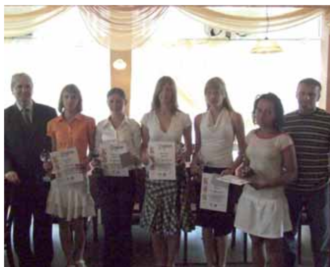
...i sportsmenki z krotoszyńskich gimnazjów