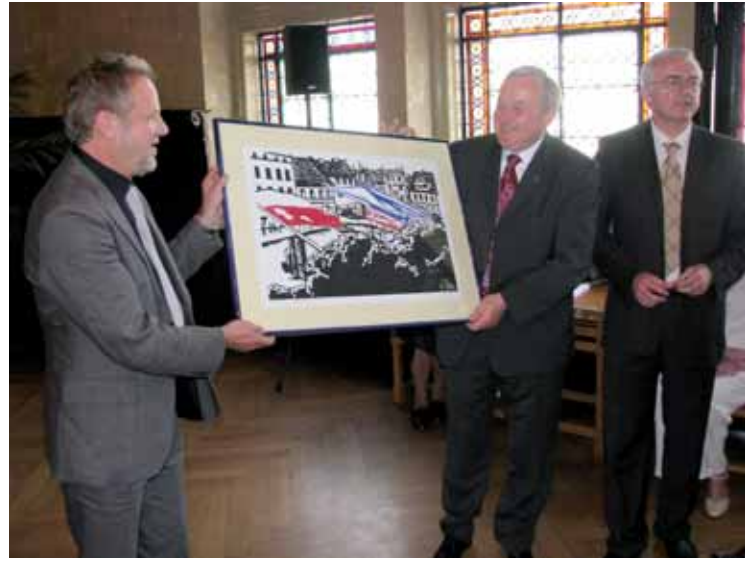
Artysta przekazał burmistrzowi jedną z prac