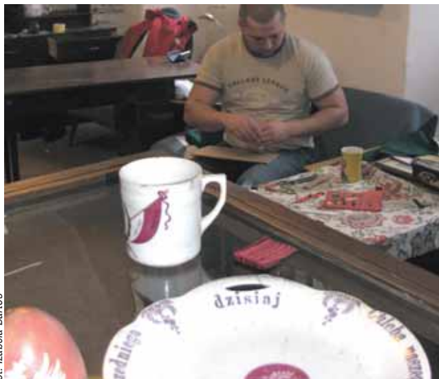
Każda wystawa muzealna poprzedzona jest długimi i żmudnymi przygotowaniem

*Na podstawie art. 18 ust. 2 pkt 15 ustawy z 8 marca 1990 roku o samorządzie gminnym (tekst jednolity DzU z 2001 roku nr 142 poz. 1591 z późn. zm.) oraz na podstawie art. 53 ust. 1 i art. 3 ust. 1 pkt 7 ustawy z 29 września 1994 roku o rachunkowości (tekst jednolity DzU z 2002 roku nr 76, poz. 694 z późn. zm.) oraz w związku z § 2 ust. 1 statutu Muzeum Regionalnego im. H. Ławniczaka.