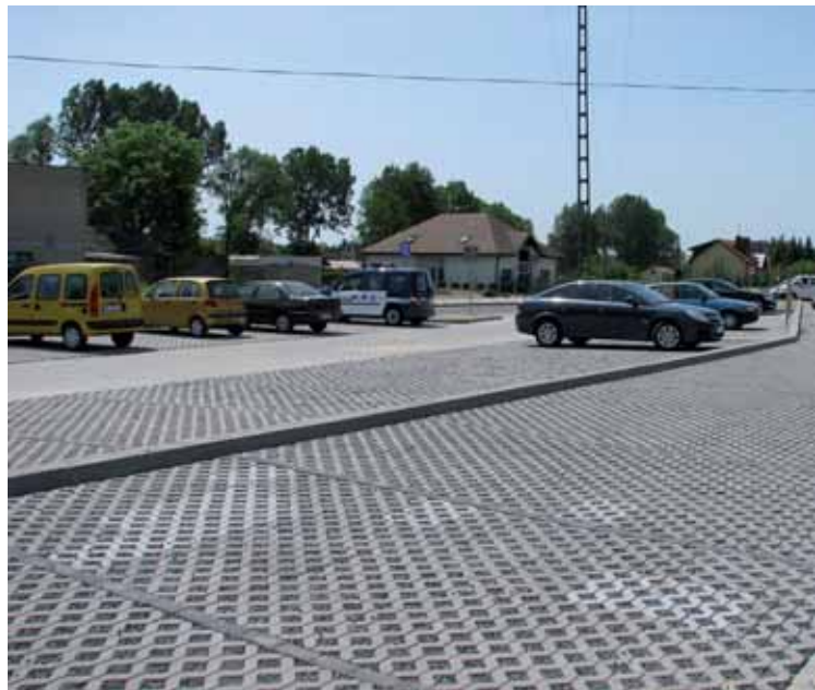
Parking na Zielonej będzie dobrze wykorzystany podczas imprez na ul. Sportowej

■ 30 maja dokonano końcowego odbioru technicznego ulicy Zielonej w Krotoszynie.