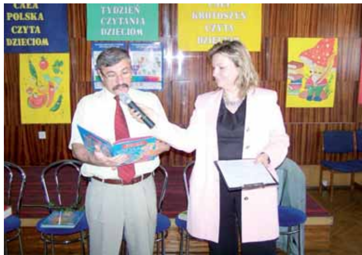
Jedną z ciekawszych imprez bibliotecznych jest cykliczne czytanie najmłodszym

■ Radni zatwierdzili* w maju sprawozdanie finansowe Krotoszyńskiej Biblioteki Publicznej im. Arkadego Fiedlera za rok 2007.