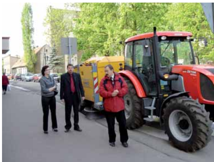
Nowa zmiatarka po raz pierwszy w użyciu

Wszystkimi pracami (poza tymi dotyczącymi zieleni) zajmie się Przedsiębiorstwo Gospodarki Komunalnej i Mieszkaniowej, które wygrało ogłoszony przez gminę przetarg na wykonywanie usług w zakresie utrzymania w czystości dróg gminnych, krajowych i powiatowych o łącznej powierzchni 107 372m 2 .