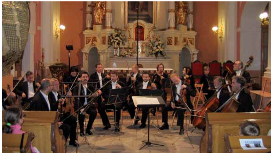
Koncerty w kościołach mają w Krotoszynie już swoją tradycję. We wrześniu minionego roku w kościele ś.ś. Piotra i Pawła koncertowała Orkiestra Kameralna Polskiego Radia Amadeus pod batutą Agnieszki Duczmal

■ Lato Organowe w Krotoszyńskiej Farze to trzyczęściowa impreza muzyczna, na którą organizatorzy zapraszają melomanów w ostatnie niedziele czerwca, lipca i sierpnia.