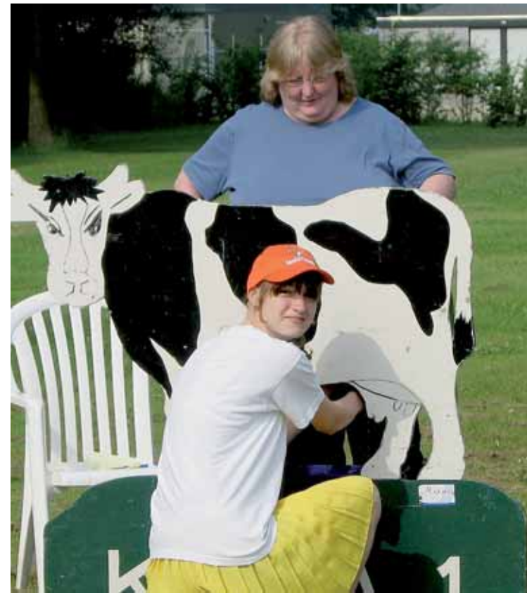
...i wprawiali się w obowiązki holenderskich rolników

Wyjazdy na wymianę pomiędzy naszymi klubami odby-