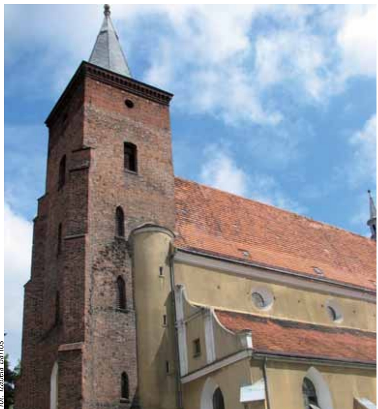
Początków historii zabytkowego kościoła należy szukać w XVI w.

■ Samorząd Krotoszyna podjął na majowej sesji decyzję* o udzieleniu dotacji Rzymskokatolickiej Parafii p.w. św. Jana Chrzciciela w Krotoszynie.