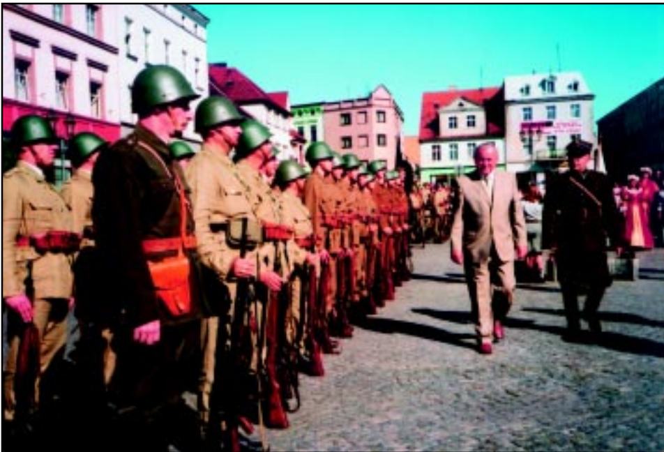
"Święto 56 Pulku Piechoty Wielkopolskiej" - 31 sierpnia 2008 r. Przeгляд wojska pod krotoszyńskim ratuszem.