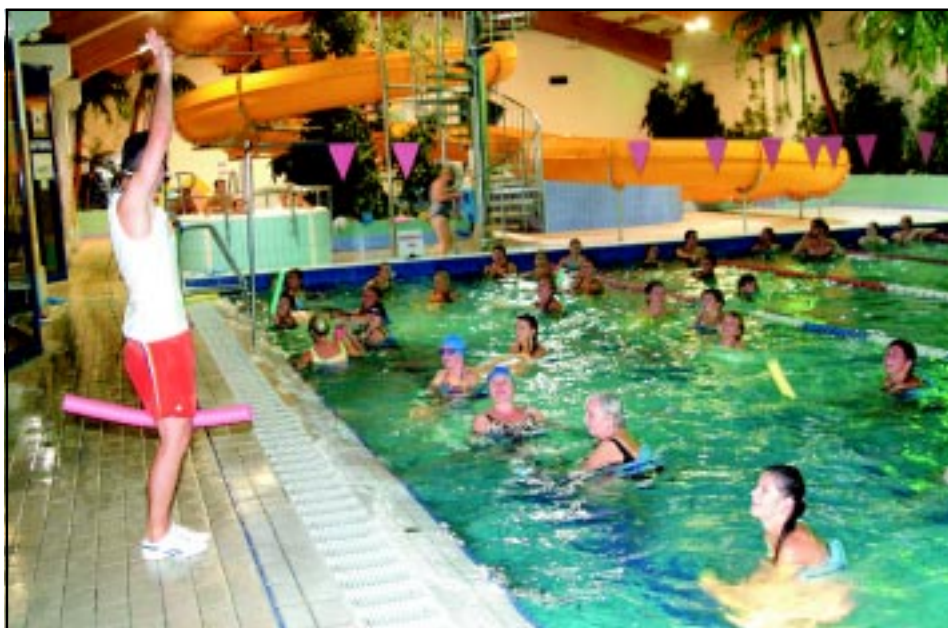
Centrum Sportu i Rekreacji "WODNIK".

Miejsko - Gminny Ośrodek Pomocy Społecznej jest autorem "Strategii integracji i rozwiązywania problemów społecznych miasta i gminy Krotoszyn na lata 2007-2013", a od 2009 roku pozyskuje środki unijne w ramach Europejskiego Funduszu Społecznego z przeznaczeniem na integrację i aktywizację społeczną osób pozostających bez pracy.