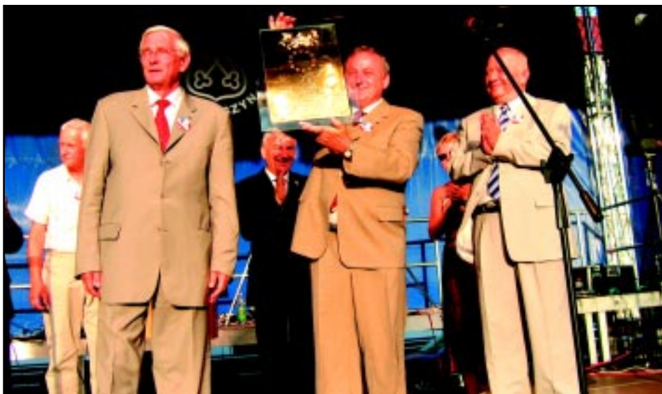
Wręczenie Honorowej Tablicy Rady Europy przez przedstawiciela Zgromadzenia Parlamentarnego Rady Europy - 30 lipca 2005 r.