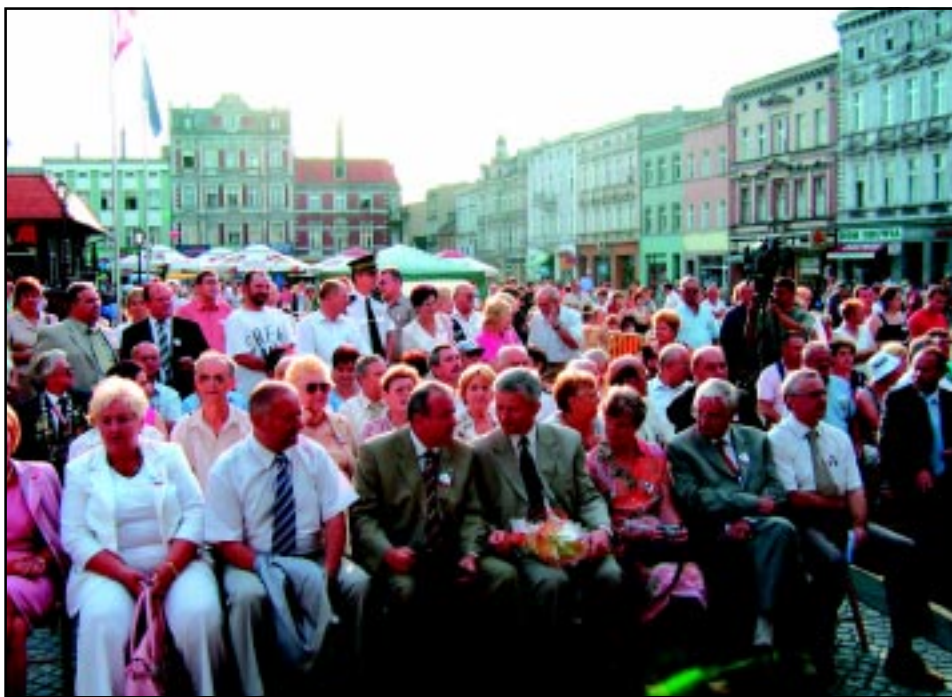
Uroczystość wręczenia Honorowej Tablicy Rady Europy - 30 lipca 2005 r.