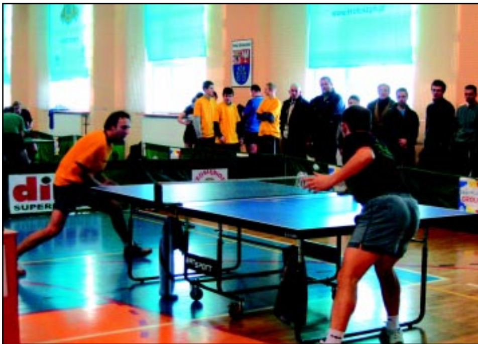
Zawody w tenisie stołowym w III Wojewódzkim Turnieju Klasyfikacyjnym Seniorów w 2006 r.