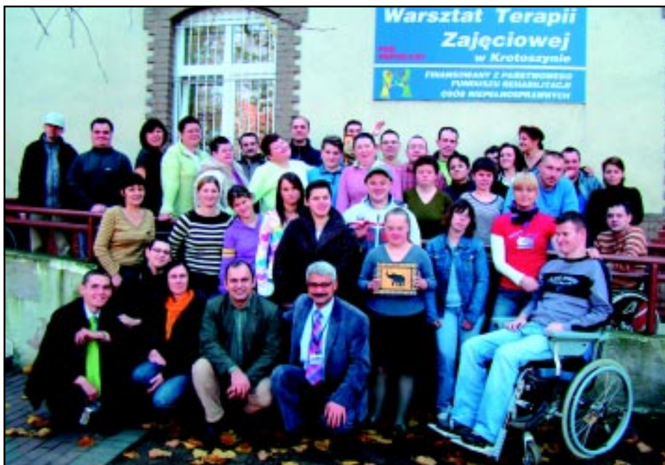
Uczestnicy i pracownicy Warsztatu Terapii Zajęciowej w 2008 r.