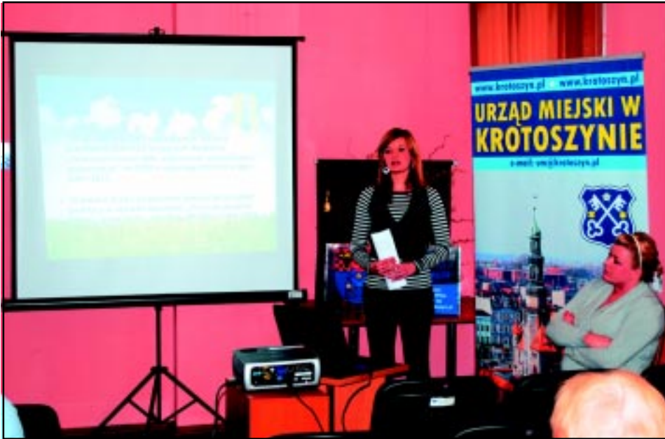
Powiatowe Forum Organizacji Pozarządowych - kwiecień 2010.