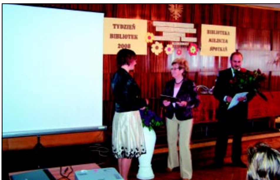
Tydzień Bibliotek w 2008 r.