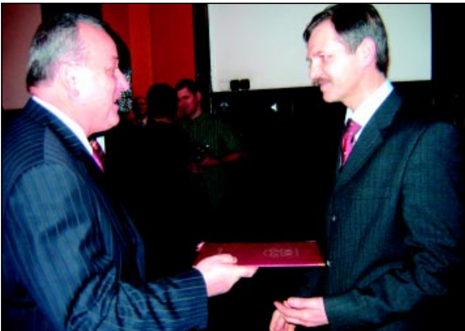
Noworoczne spotkanie Burmistrza z przedsiębiorcami w 2006 r.