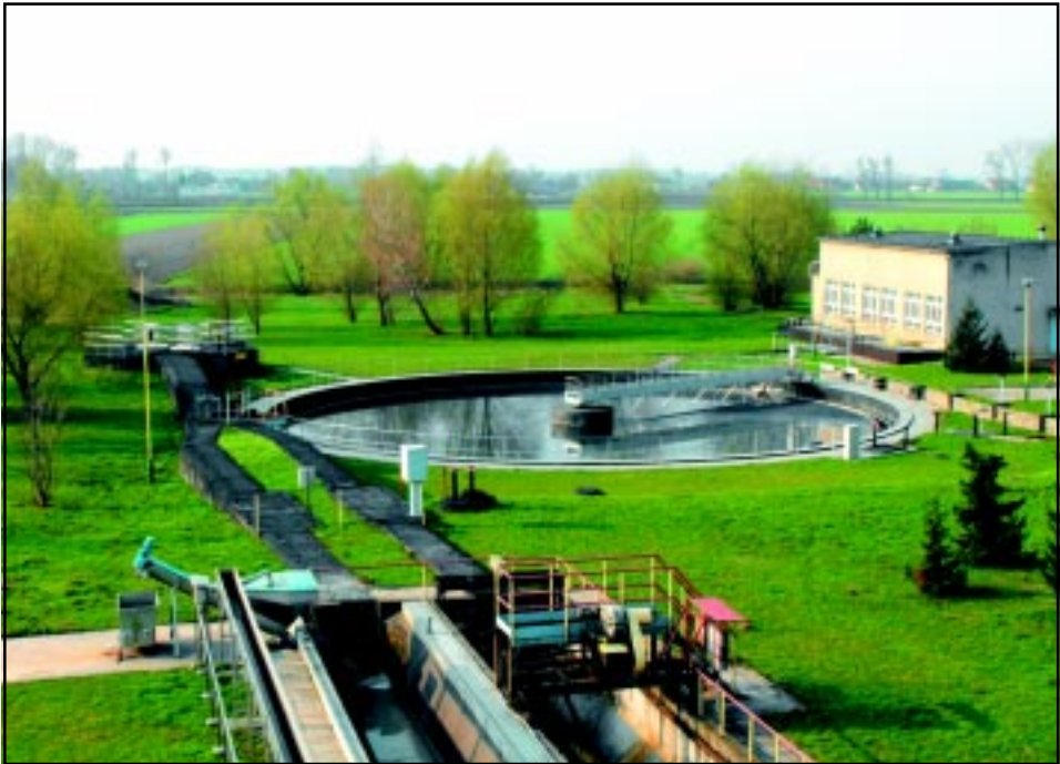
Fragment oczyszczalni ścieków w Krotoszynie.