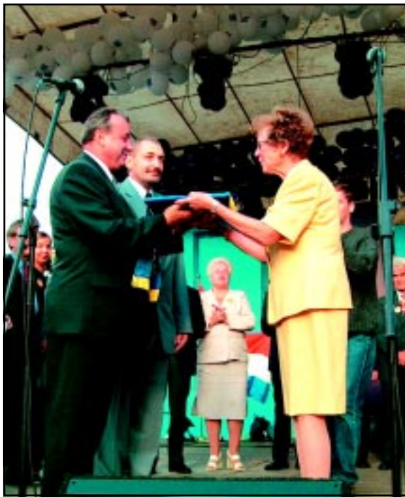
Uroczystość wręczenia Honorowej Flagi Rady Europy przez przedstawicielkę Zgromadzenia Parlamentarnego Rady Europy - 7 września 2001 r.