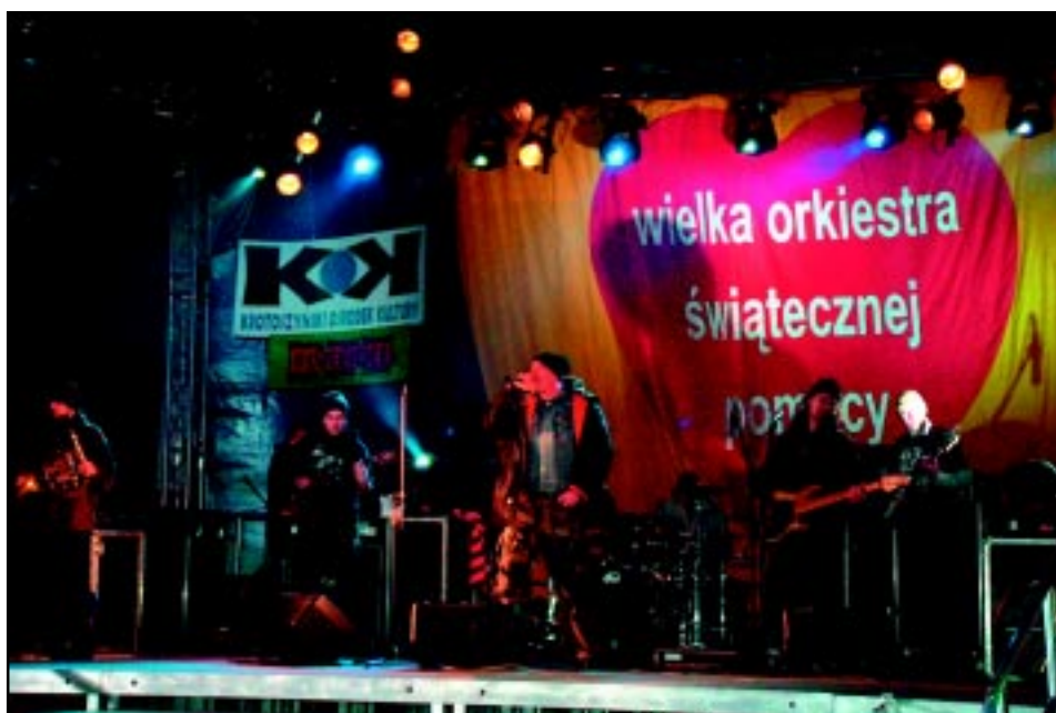
13. Finał Wielkiej Orkiestry Świątecznej Pomocy w Krotoszynie.