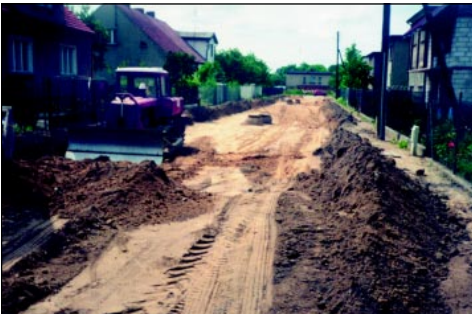
Budowa ul. Krotoskiego w Krotoszynie w czerwcu 1997 r.