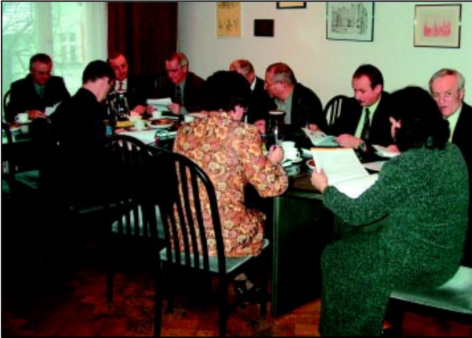
Prace nad strategią rozwoju Miasta i Gminy Krotoszyn na lata 2005-2014.