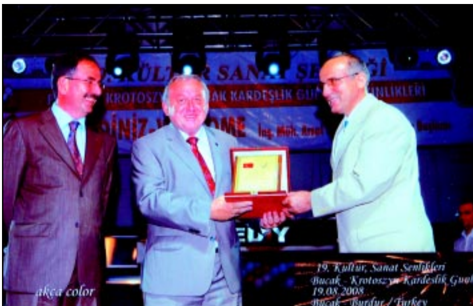
Uroczystość inauguracji projektu "Most Przyjaźni i Współpracy" pomiędzy Krotoszyn/Polska a Bucak/Turcja.

Główny ciężar współpracy spoczywa na barkach powołanych do tego celu towarzystw przyjaźni czy też współpracy z zagranicznymi gminami. Niezależnie od towarzystw współpracą zajmują się także szkoły i stowarzyszenia.