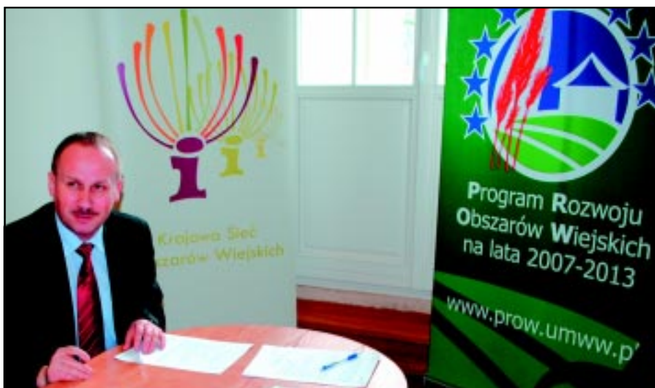
Podpisanie aneksu umowy przyznania pomocy w ramach działania "Funkcjonowanie LGD, nabywanie umiejętności i aktywizacja" na rok 2009.

Nie sposób w tak zwięzłym opracowaniu przedstawić działalności wszystkich stowarzyszeń. Ich pełny wykaz umieszczony jest w specjalnym informatorze* oraz na stronie internetowej CKI. W kwietniu 2010 roku odbyło się kolejne forum organizacji pozarządowych gminy i powiatu.