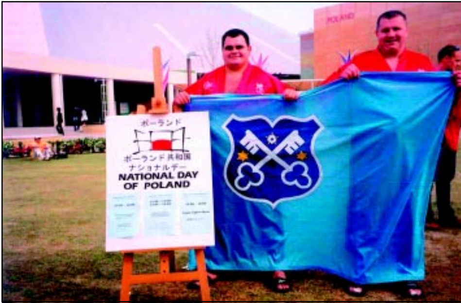
Zawodnicy TA Rozum na EXPO 2005 w Japonii.