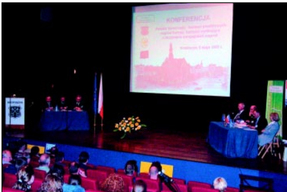
6 maja 2005 r. Konferencja miast wyróżnionych nagrodami Rady Europy.