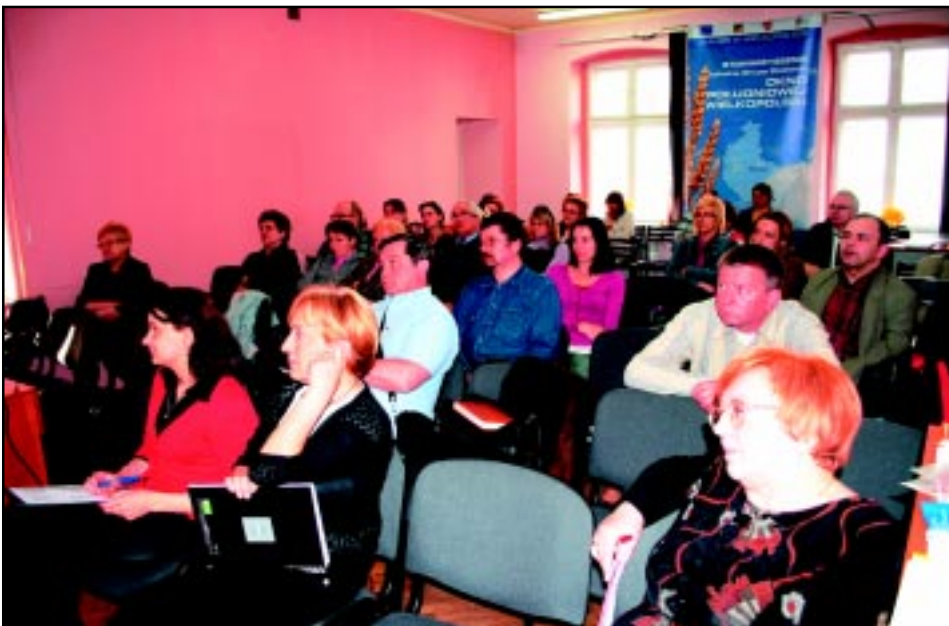
Powiatowe Forum Organizacji Pozarządowych - kwiecień 2010.