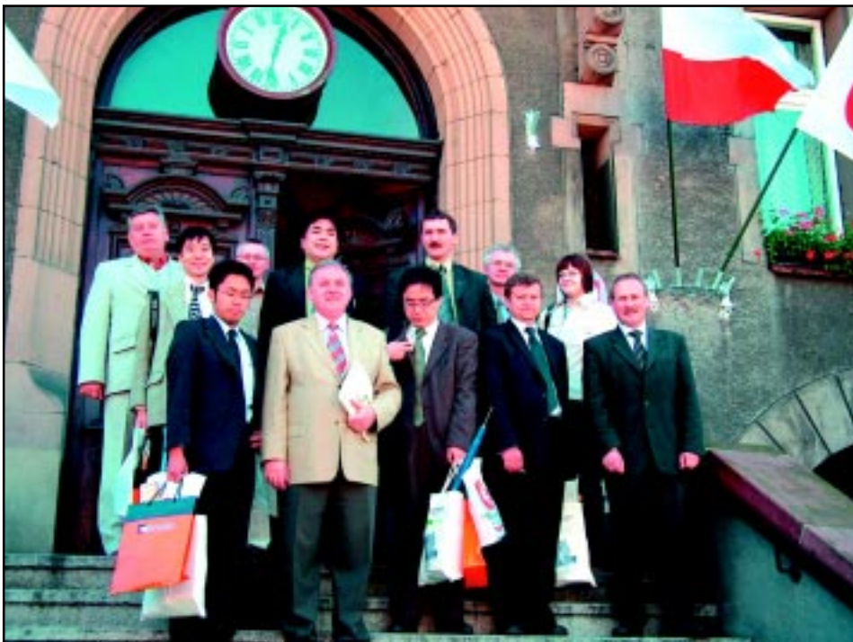
Wizyta japońskich dziennikarzy w maju 2005 r.