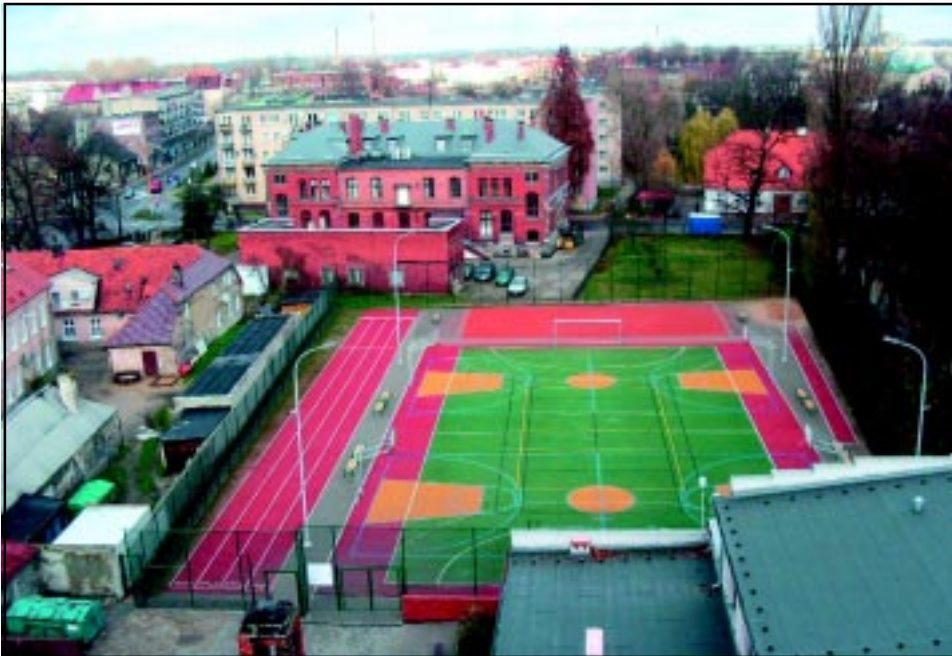
Boisko sportowe przy Szkole Podstawowej nr 4 w Krotoszynie.