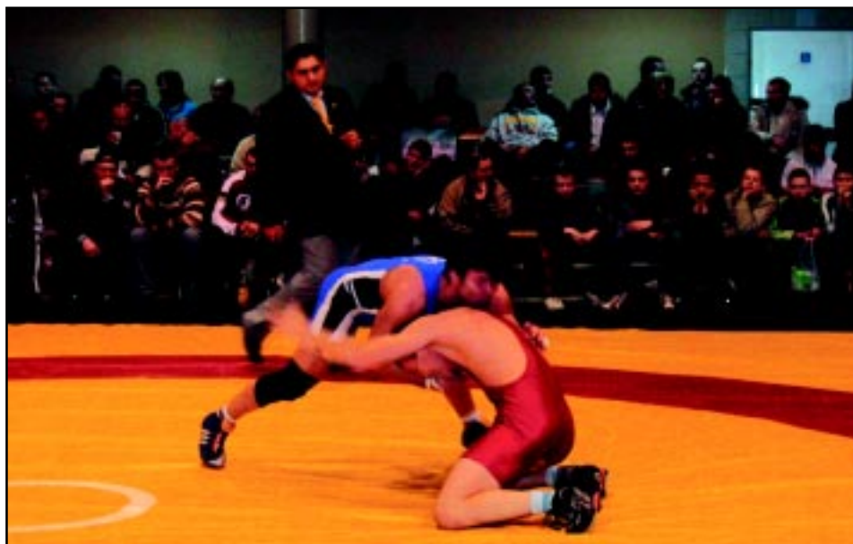
Zapasy w styczniu 2006 r. o Puchar Polski Seniorów.