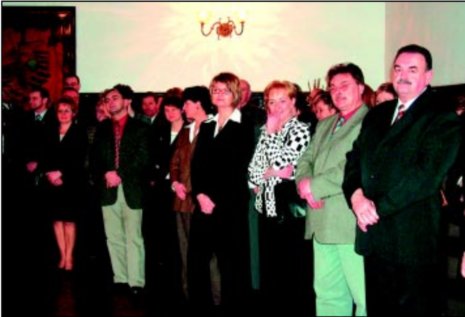
Noworoczne spotkanie Burmistrza z przedsiębiorcami w 2005 r.