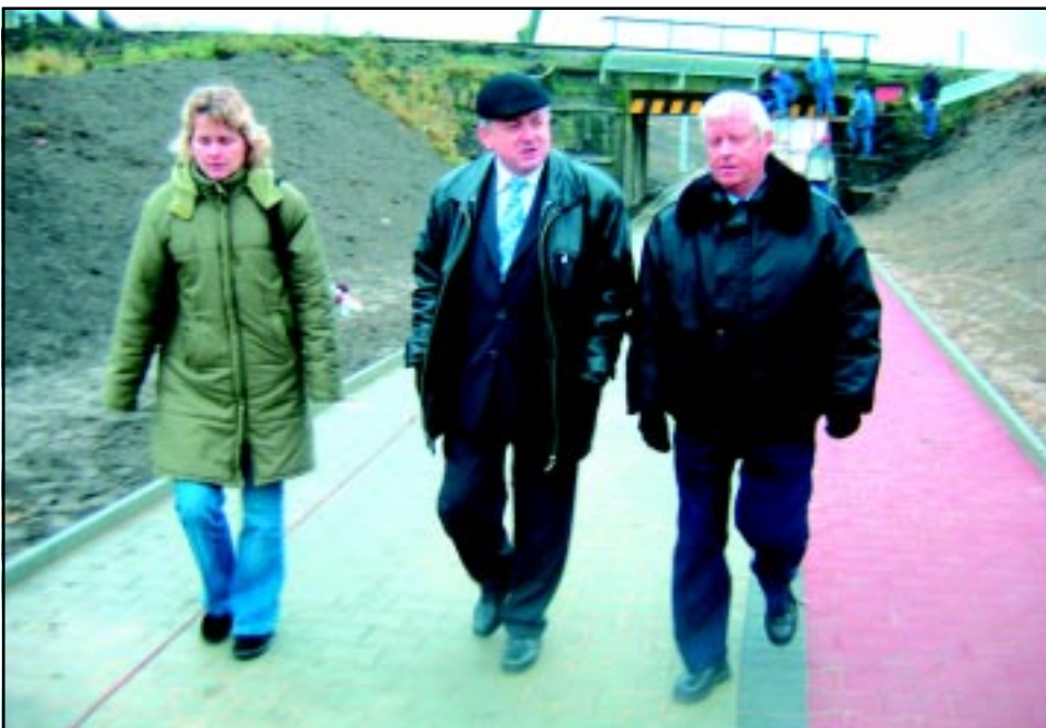
Odbiór przejścia pieszo-rowerowego z osiedli mieszkaniowych do kościoła parafialnego p.w. bl. bp. Michała Kozala w Krotoszynie.