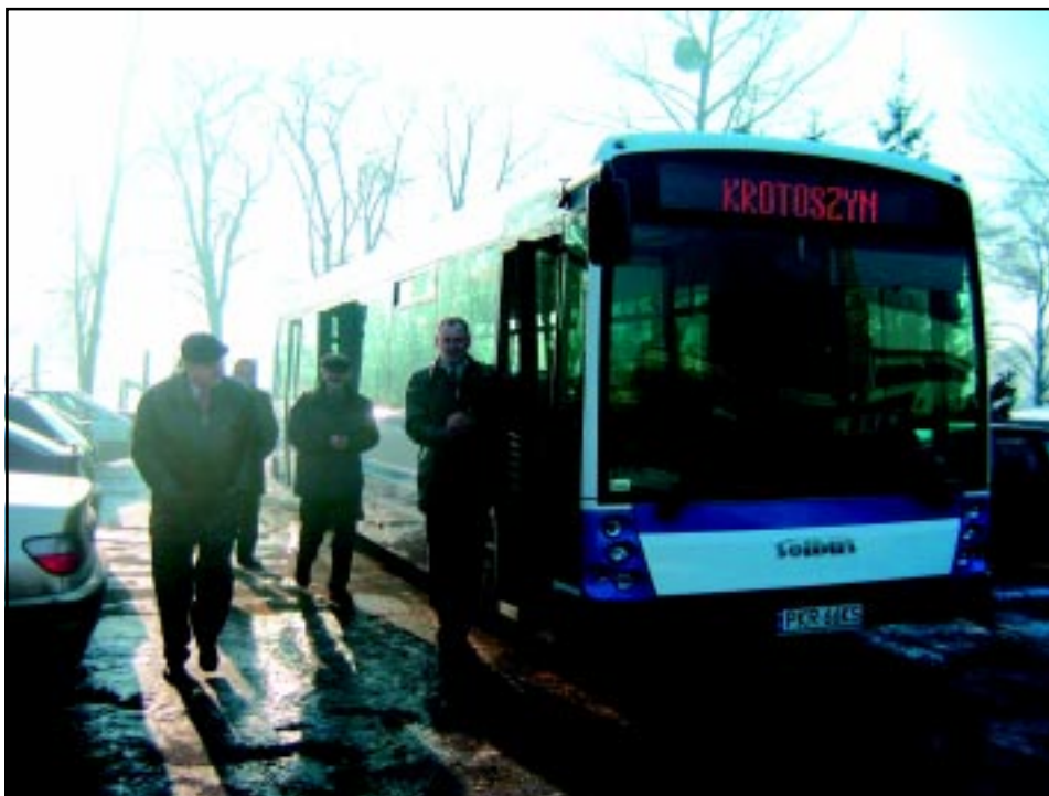
Nowy autobus dla MZK.

nuje jako spółka prawa handlowego. W pierwszym roku swego istnienia ZEC ogrzewał 701,5 tys. m 3 , o powierzchni prawie 150,9 tys. m 2 , dostarczając ciepłą wodę do budynków o powierzchni 64,5 tys. m 2 .