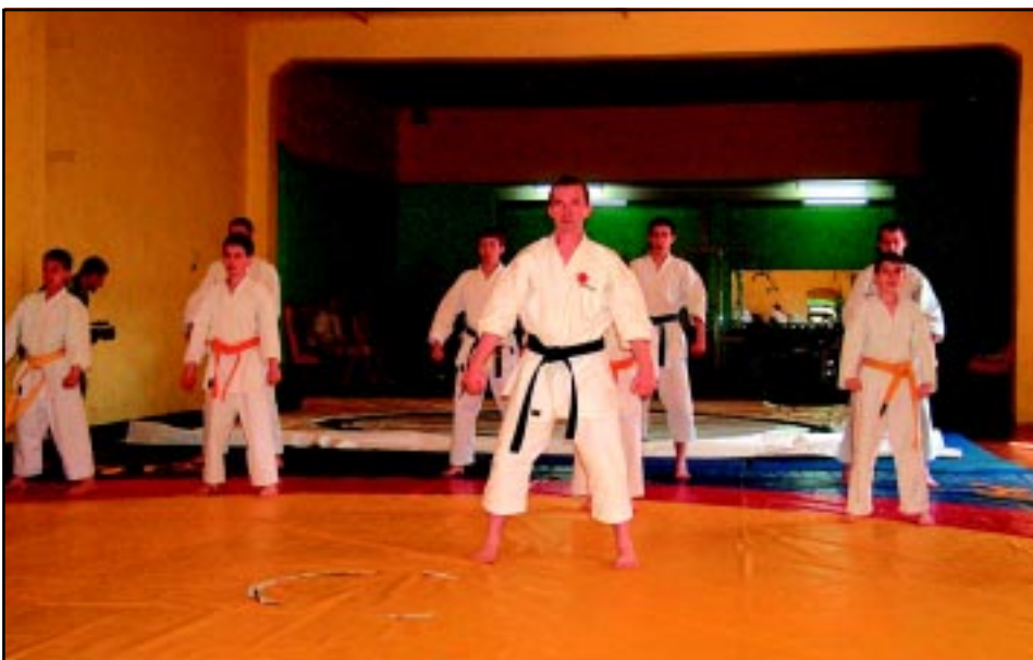
Pokaz karate - maj 2005 r.