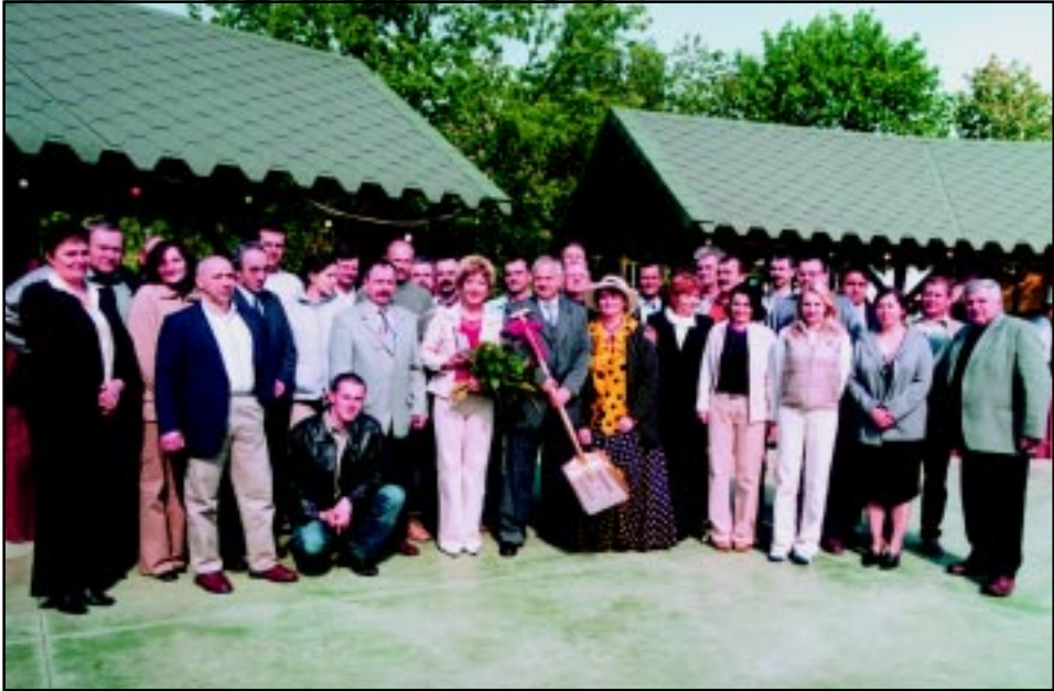
Święto Pracowników Komunalnych w 2004 r. - pracownicy Zakładu Energetyki Ciepłej.