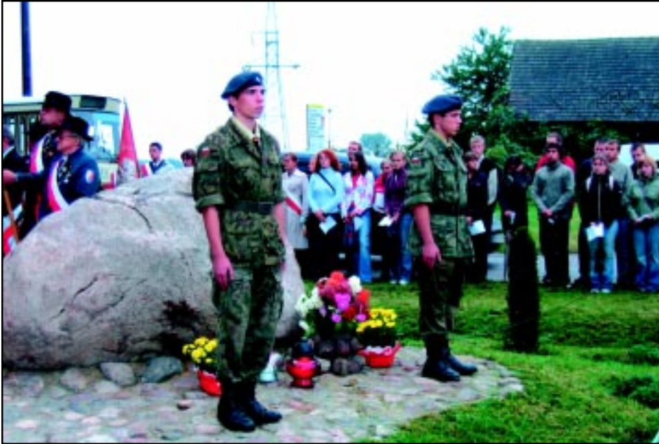
Uroczystości na szancku ku czci poległym żołnierzom 56 Pulku Piechoty.