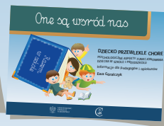
DZIECKO PRZEWLEKLE CHORE PSYCHOLOGICZNE ASPEKTY FUNKCJONOWANIA DZIECKA W SZKOLE I PRZEDSZKOLU