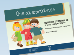
DZIECKO Z HEMOFILIĄ W SZKOLE I PRZEDSZKOLU