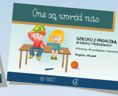
DZIECKO Z PADACZKĄ W SZKOLE I PRZEDSZKOLU