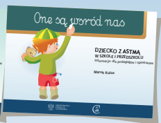
DZIECKO Z ASTMĄ W SZKOLE I PRZEDSZKOLU