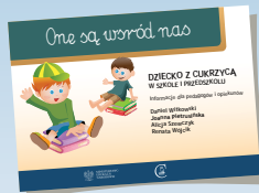
DZIECKO Z CUKRZYCĄ W SZKOLE I PRZEDSZKOLU

Dotychczas w serii „One są wśród nas” ukazały się: