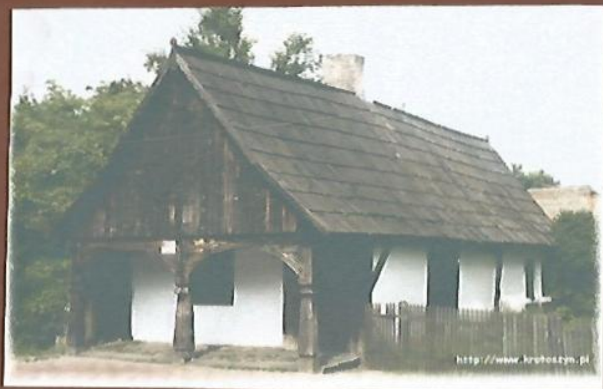
Krotoszanka najstarszy zachowany dom w Krotoszynie z 2 poł. XVIII w.