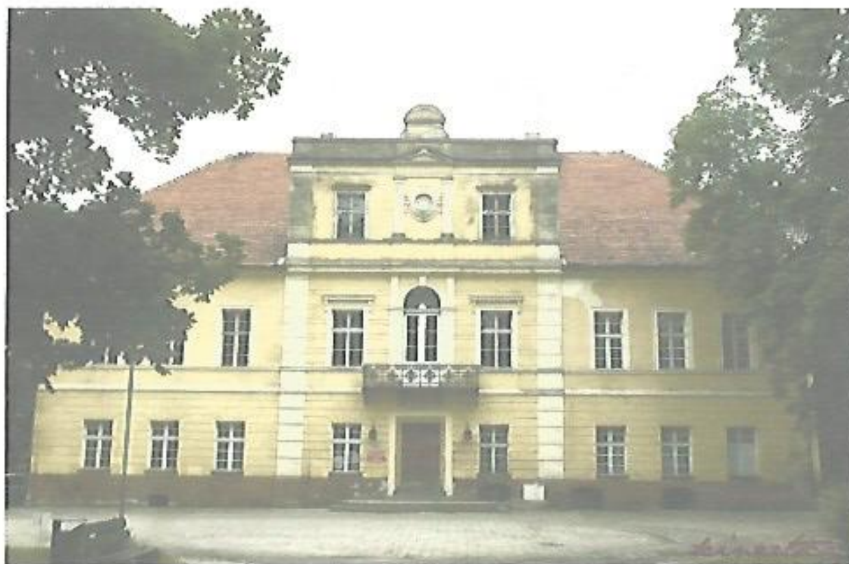
Pałac Galeckich z lat 1692-1700, przebudowany w roku 1820 otrzymał późnoklasycystyczną fasadę, murowany z cegły, otynkowany.