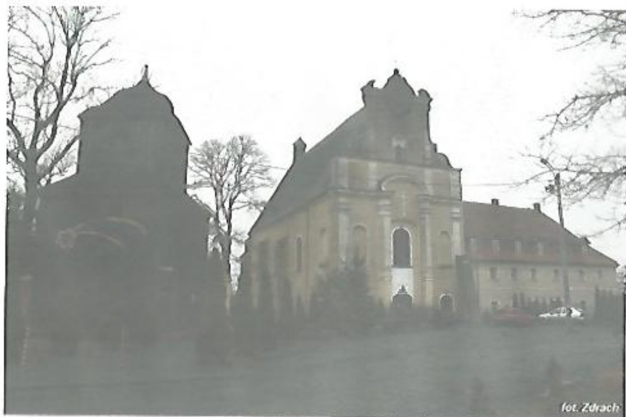
Kościół klasztorny bernardynów w Kobylinie zbudowany wraz z klasztorem w XVI-XVII w., w którym mieści się renesansowy nagrobek (postać leżącego rycerza w zbroi), wraz z drewnianą dzwonnica pochodzącą z XVIII w.