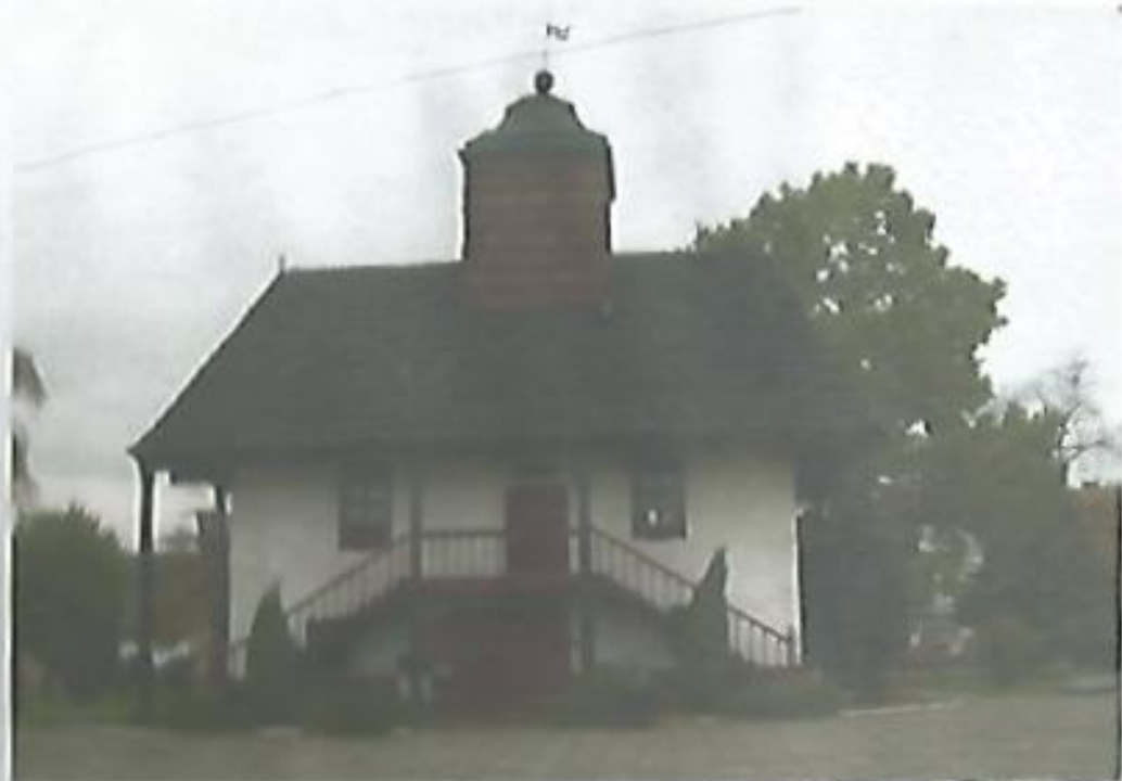
Drewniany ratusz w Sulmierzycach niedaleko Krotoszyna, oddany do użytku 3 czerwca 1743 roku, przetrwał czasy zaborów, był świadkiem odzyskania niepodległości i z trudem zniósł okupację. Ale udało się i można go zwiedzać i podziwiać.