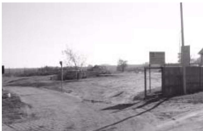
Wysypisko odpadów w Krotoszynie

go swoje opinie na temat lokalizacji przyszłego składowiska wraz z uzasadnieniem ekonomicznym takiego stanowiska. (Czesław Ossowski)