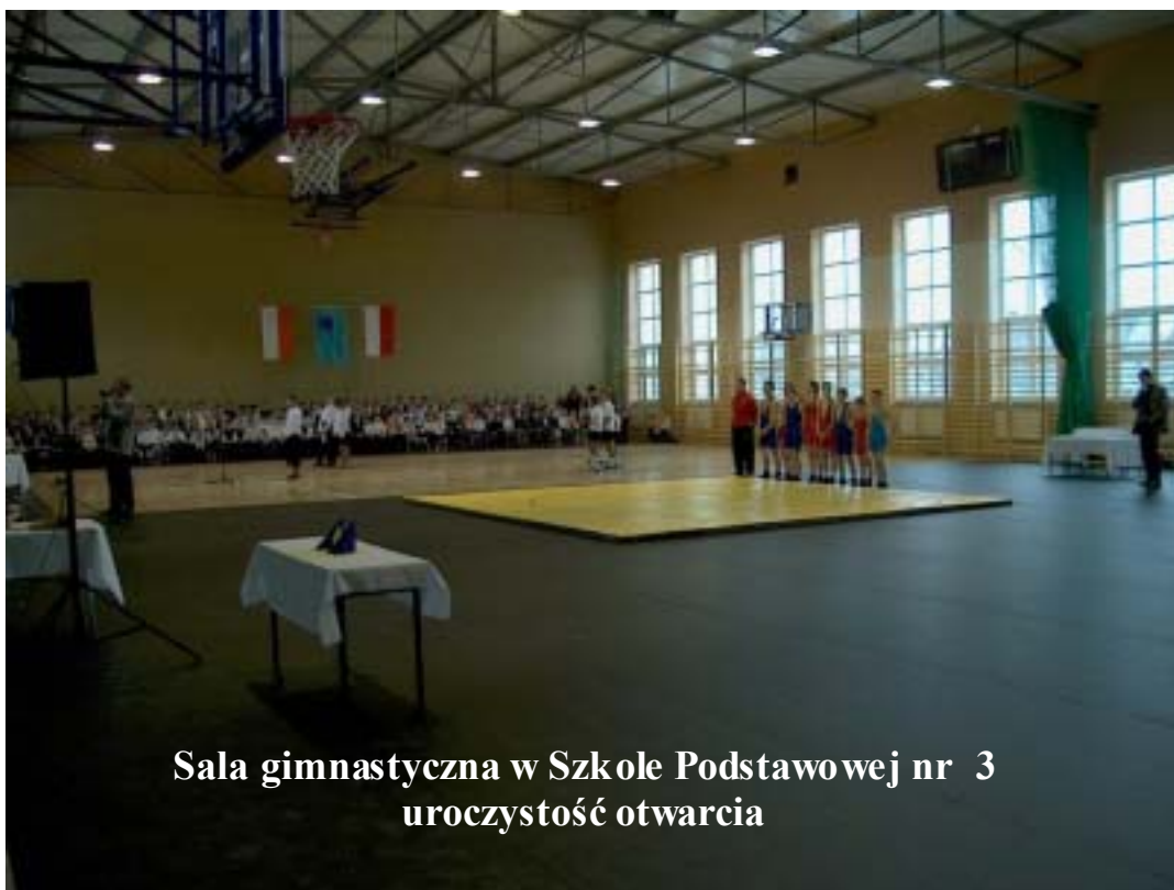
Sala gimnastyczna w Szkole Podstawowej nr 3 uroczystość otwarcia

deczni e podziękować za ich bezinteresowną pomoc i wkład w rozwój oświaty i sportu na terenie całej naszej gminy.