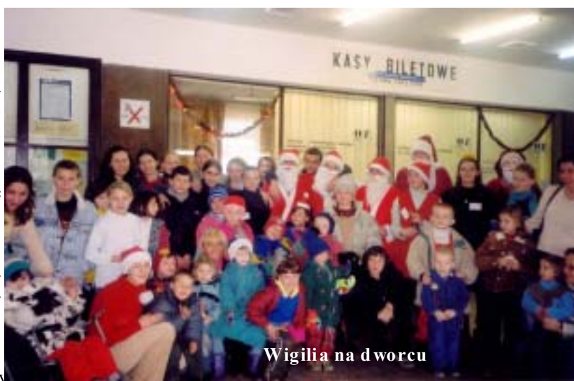
Wigilia na dworcu

Uczymy się wszyscy jednośi i choć różnymi się w swoich poglądach, gdy zajdzie potrzeba, stajemy obok siebie. Kolejne spotkania pomogą się nam lepiej zorganizować. Już teraz wiemy, co trzeba poprawić przy następnej takiej okazji. Niezadowolonych, którzy wiedzą lepiej, jak to zrobić, zapraszamy do współpracy.