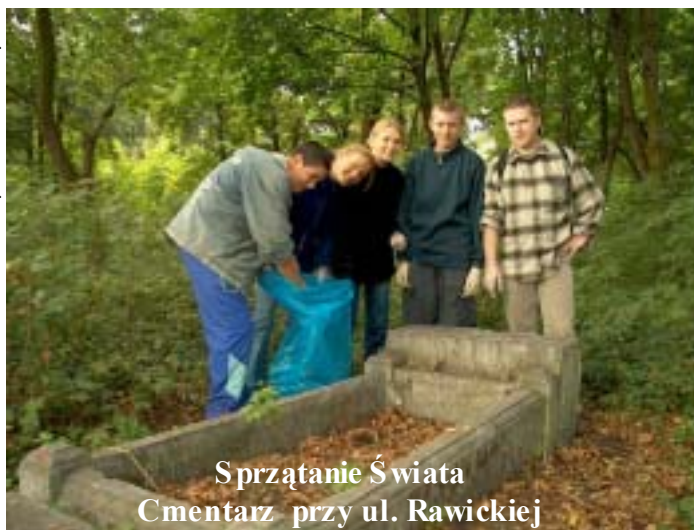
Sprzątanie Świata Cmentarz przy ul. Rawickiej