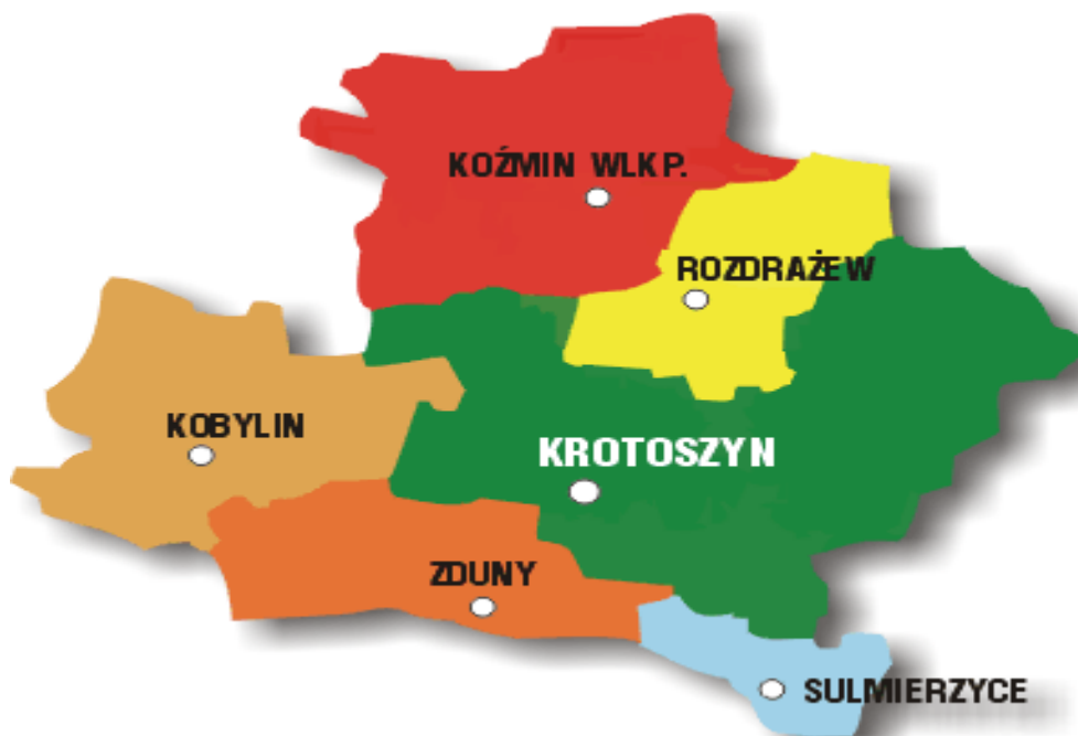
Mapka 2. Położenie gminy Krotoszyn.